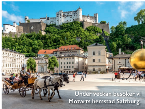
Under veckan besöker vi Mozarts hemstad Salzburg.